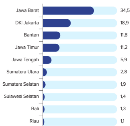
Top 10 provinsi dengan jumlah pengguna PayLater terbanyak berdasarkan jenis transaksi online (%)